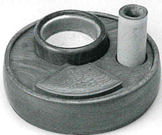
たばこぼん 煙草盆

主に刻み煙草用の喫煙用具。火種を入れる火入れと吸殻を入れる灰落しを組にして一つの器に入れている。